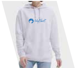
1 Colore Serigrafico