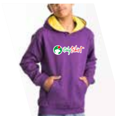
Ricamo (1 o più colori)