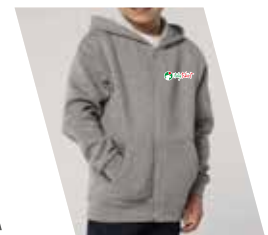
Ricamo (1 o più colori)