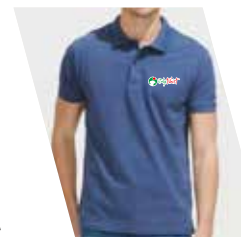
Ricamo (1 o più colori)