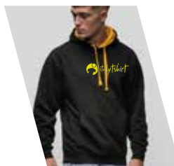
1 Colore Serigrafico