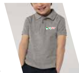
Ricamo (1 o più colori)