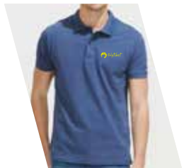
1 Colore Serigrafico