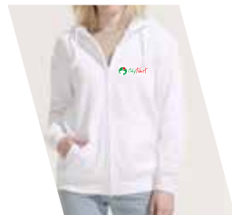
Ricamo (1 o più colori)