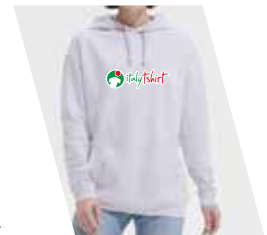
Ricamo (1 o più colori)