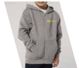
1 Colore Serigrafico