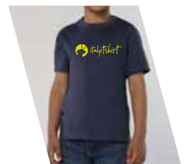
1 Colore Serigrafico

T-shirt Bianca -0,10€. Tenere presente che su capi scuri (in serigrafia) andrà obbligatoriamente inserita la BASE al costo di 0,18€ cad. +Telaio a 30,00 €