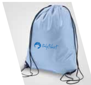
1 Colore Serigrafico

Tenere presente che su zaini scuri (in serigrafia) andrà obbligatoriamente inserita la BASE al costo di 0,18 € cad. +Telaio a 30,00 €