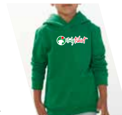
Ricamo (1 o più colori)