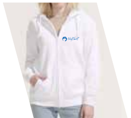
1 Colore Serigrafico