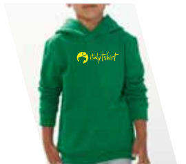
1 Colore Serigrafico