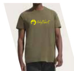
1 Colore Serigrafico

T-shirt Bianca -0,10€. Tenere presente che su capi scuri (in serigrafia) andrà obbligatoriamente inserita la BASE al costo di 0,18€ cad. +Telaio a 30,00 €