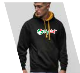
Ricamo (1 o più colori)