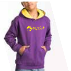
1 Colore Serigrafico